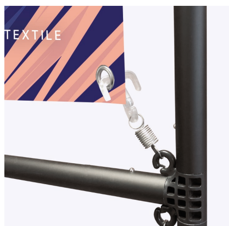
Fixation de l'affiche grâce à 4 œillets.